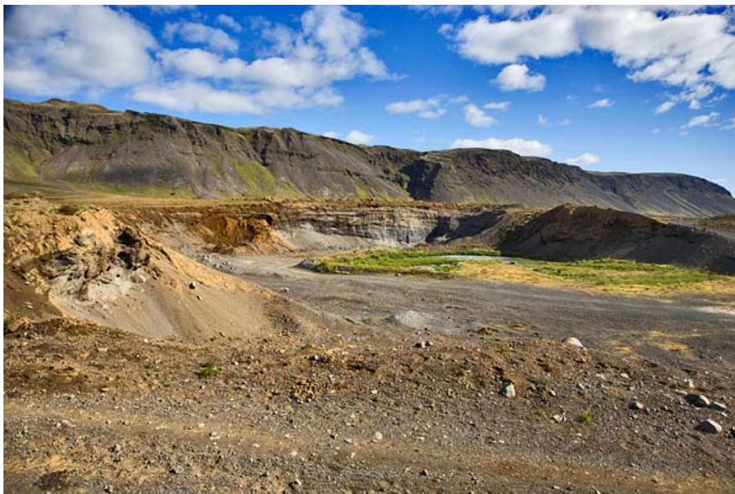
5. mynd. Náman á svæði 2, Ingólfsfjall fjær, 25. ágúst 2011.

Umhverfisstofnun 2011. Náttúruminjasrá. Sótt 22.8.2011 af: http://www.ust.is/einstaklingar/nattura/natturuminjaskra/sudurland/